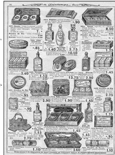
Page extrait du catalogue du magasin « Printemps Paris » 1913

Ils demandent à votre administration qui est la leur qu'ils leur en sois vendus es livré des magasins de commune affranchie douze quintaux, soit par votre médiation soit par requisition ou de toute autres manière que votre administration jugera plus convenable.