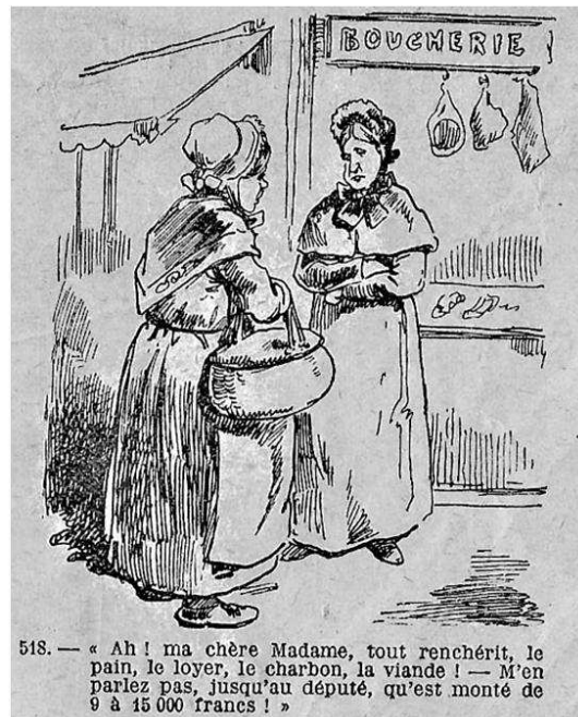
Extrait d'une revue datant de 1906 visible au musée