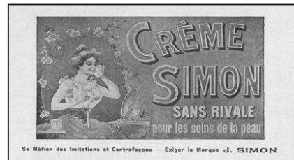
Réclame extraite de l'Agenda des « Deux Passages de Lyon » 1891